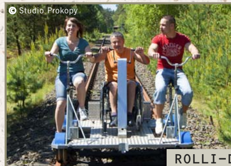
ROLLI-DRAISINE für 3 Personen