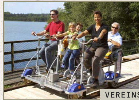
VEREINSDRAISINE für 3 – 5 Personen