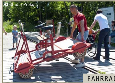
FAHRRADDRAISINE für 2 – 4 Personen

Weitere Draisinentouren – südlich von Berlin – finden Sie auf www.erlebnisbahn.de